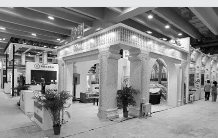
اقتصادی بین فعالان صنعتی، تجاری و اقتصادی تصریح کرد: در این نمایشگاه به منظور برگزاری

مذاکرات BYB فلان اقتصادی کشور با تجار چینی و همچنین تجار دیگر کشورها در نظر گرفته شده بود. مدیرعامل شرکت شهرک‌های صنعتی فارس در با اشاره به استقبال خوب بخش خصوصی از این رویداد گفت: با هماهنگی‌های انجام شده بین سازمان صنایع کوچک و شهرک‌های صنعتی ایران و همراهی سرکنسولگری کشورمان در گوانگجو، ایران را به مهم‌ترین شریک خارجی چین در نمایشگاه امسال تبدیل کرده است. وی گفت: استان فارس بیشترین تعداد را در صنعتگران استان‌های کشور به خود اختصاص داده است. وی تصریح کرد: بخشی از هزینه‌های این نمایشگاه از محل کمک‌های پارتی‌های سازمان صنایع کوچک و شهرک‌های صنعتی بعنوان حمایت از واحدهای شرکت‌کننده پرداخت شده است.