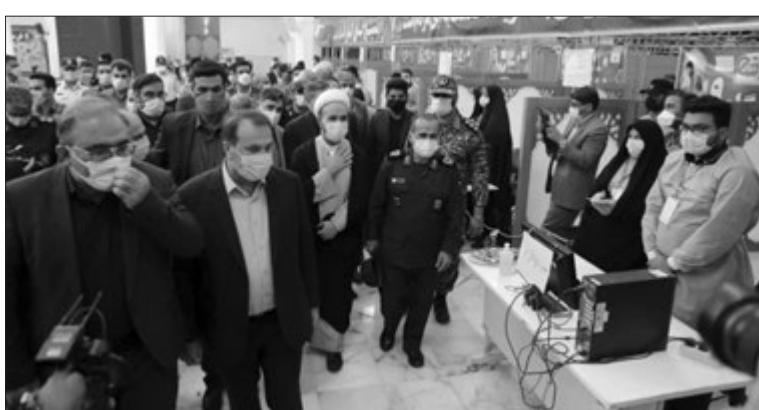
استاندار فارس اضافه کرد: تاکنون ۵۰۰ هزار نفر از مشمولان دریافت واکسن نیز جهت تزریق مراجعه