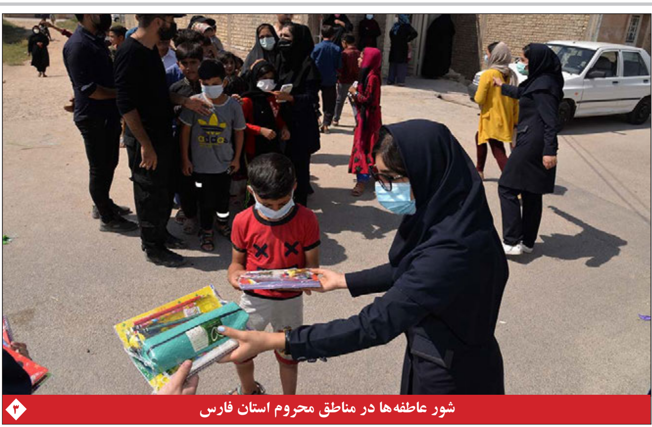
شور عاطفه‌ها در مناطق محروم استان فارس

نماینده اتحادیه اروپا با اعتراف به عواقب خروج یکجانبه آمریکا از برجام تصریح کرد برطرف شدن تحریم‌ها، بخش حیاتی این توافق به شمار می‌رود. به گزارش اپرنا، «آنزله لوگار» وزیر امور خارجه اسلونی دیروز (دوشنبه) بیانیه مشترک کشورهای عضو اتحادیه اروپا را در شصت و پنجمین نشست مجمع عمومی آژانس بین‌المللی انرژی اتمی که در وین جریان دارد، قرائت کرد. وی بیان داشت: اتحادیه اروپا در این مقطع حساس پایبندی خود را به برنامه جامع اقدام مشترک (برجام) و حمایت از اجرای کامل و موثر آن اعلام می‌کند. اتحادیه اروپا همچنین به مسائل مرتبط با خروج یکجانبه آمریکا از برجام و اعمال دوباره تحریم‌ها اعتراف می‌کند. وزیر خارجه اسلونی خاطر نشان کرد که رفع تحریم‌های برجامی، در کنار اجرای کامل و قابل راستی آزمایشی تعهدات ایران، بخش مهمی از این توافق به‌شمار می‌رود.