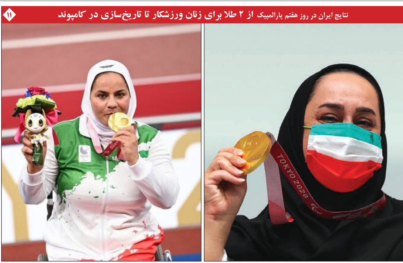
نتایج ایران در روز هفتم پارالمپیک از ۲ طلا برای زنان ورزشکار تا تاریخ‌سازی در کامپوند

تاکید معاون اول قوه قضاییه بر هوشمندسازی فرآیندهای قضایی اعلام آمادگی دبیر کل سازمان ملل متحد برای همکاری با دولت ایران ایران بر حق دسترسی عادلانه به فضای ماوراء جو تاکید کرد وزیر اقتصاد: خط اعتباری باید جایگزین تسهیلات بانکی شود رئیس بانک مرکزی: تداوم روند نزولی قیمت ارز مشکلی در تامین ارز واکسن کرونا نداریم سرنوشت نامعلوم ۱۰۰ هزار میلیارد تومان ارز دولتی!