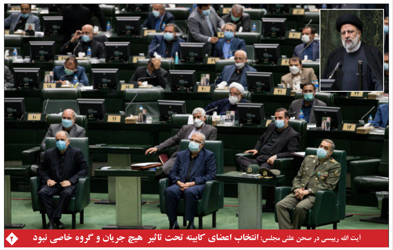
آیت الله رئیسی در صحن علنی مجلس: انتخاب اعضای کابینه تحت تأثیر هیچ جریان و گروه خاصی نبود

عضو کمیسیون امنیت ملی کمیسیون امنیت ملی روی وزیر پیشنهادی اطلاعات اتفاق نظر دارد نیکی هیلی: انتضاح بایدن در افغانستان روی امنیت آمریکا تأثیر عمیقی می گذارد نائب رئیس اتاق بازرگانی ایران: تجارت خارجی لازمه رشد اقتصاد پایدار است در گفتگو با وزیر پیشنهادی صنعت، معدن و تجارت مطرح شد: از احتمال آزادسازی واردات خودرو تا پایان جدال بر سر تفکیک وزارتخانه کمیسیون امنیت ملی: توافق نظر دارد کمیسیون امنیت ملی: نیکی هیلی: انتضاح بایدن در افغانستان روی امنیت آمریکا تأثیر عمیقی می گذارد نائب رئیس اتاق بازرگانی ایران: تجارت خارجی لازمه رشد اقتصاد پایدار است در گفتگو با وزیر پیشنهادی صنعت، معدن و تجارت مطرح شد: از احتمال آزادسازی واردات خودرو تا پایان جدال بر سر تفکیک وزارتخانه کمیسیون امنیت ملی: توافق نظر دارد