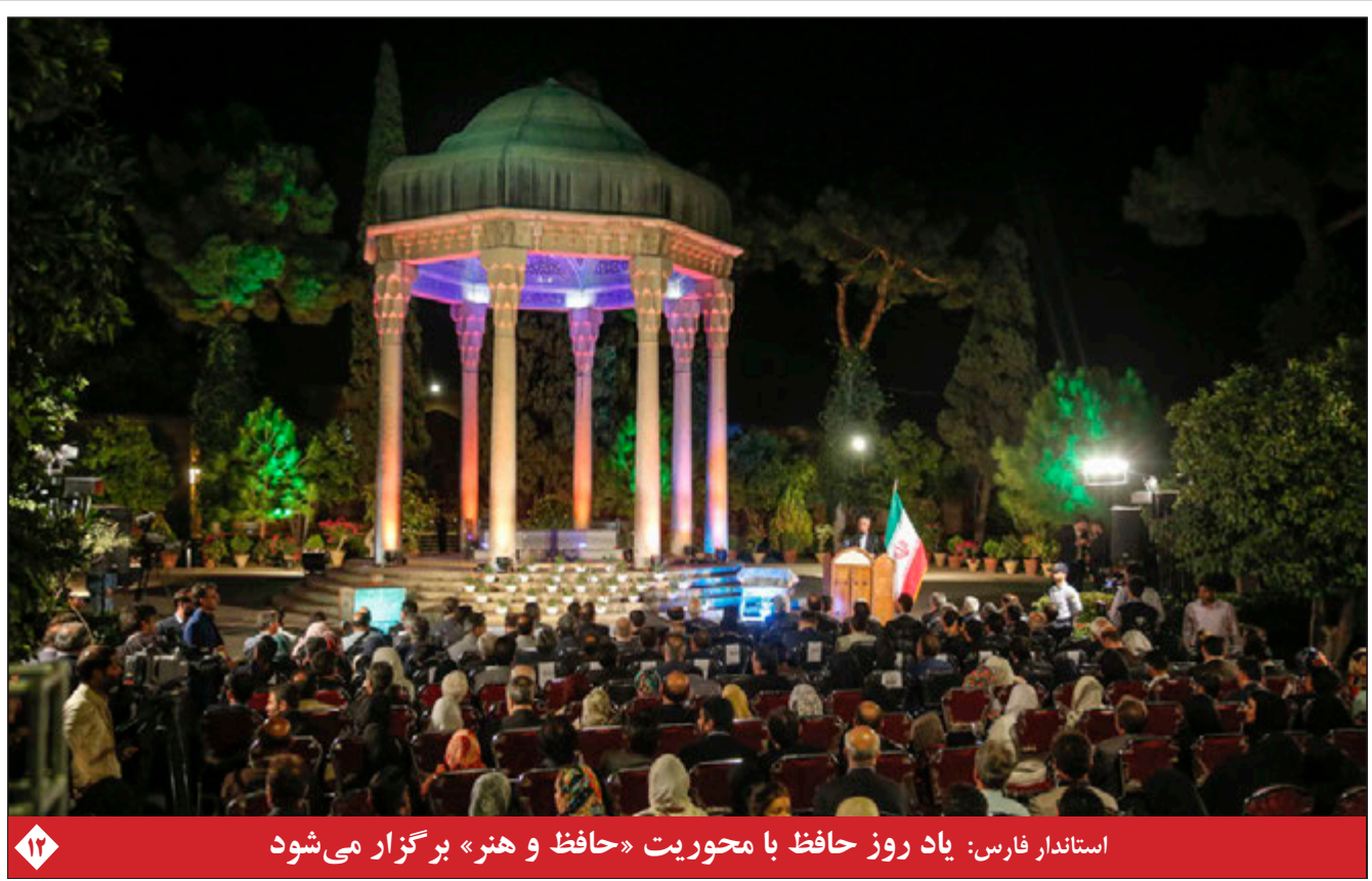
استاندار فارس: یاد روز حافظ با محوریت «حافظ و هنر» برگزار می‌شود

رکورد مراجعه روزانه به مراکز ۱۶ ساعته فارسی شکست