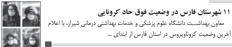
۱۱ شهرستان فارس در وضعیت فوق حاد کرونایی معاون بهداشت دانشگاه علوم پزشکی و خدمات بهداشتی درمانی شیراز، با اعلام آخرین وضعیت کروناویروس در استان فارس از ابتدای ...