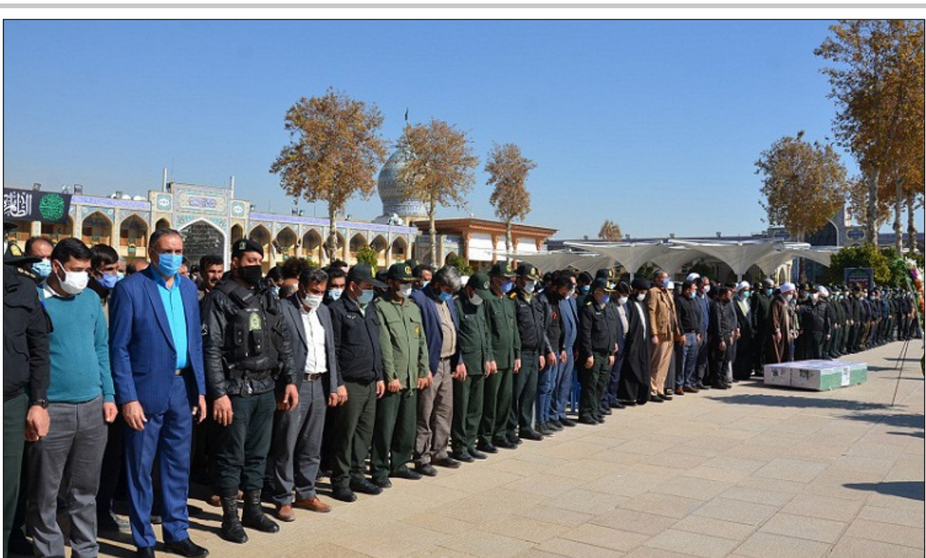
شهدای ناجا در حرم شاهچراغ (ع) تشییع شدند

روسای قوای سه گانه عصر دیروز و بعد از نشست مشترک که به میزبانی دستگاه قضا برگزار شد، بر لزوم قطع وابستگی بودجه به نفت و تأمین معیشت و سلامت مردم تأکید کردند. به گزارش خبرنگار سیاسی ایرنا حجت الاسلام والمسلمین حسن روحانی رئیس جمهوری، حجت الاسلام والمسلمین سید ابراهیم ریسی قوه قضاییه و محمد باقر قالیباف رئیس قوه مقننه عصر دیروز بعد از نشست مشترک که به میزبانی دستگاه قضا برگزار شد، بر لزوم قطع وابستگی بودجه به نفت و تأمین معیشت و مقابله با کرونا و سلامت مردم تأکید کردند. حجت الاسلام والمسلمین حسن روحانی سلامت، معیشت، بی اثر کردن و لغو تحریم های ظالمانه را محورهای گفت و گوهای این نشست ذکر کرد و افزود: در زمینه سلامت، مردم کار بسیار بزرگی در این مدت انجام دادند و با اجرای دقیق پروتکل های بهداشتی آمار فوتی ها دوباره به دورقمی برگشت و برای ما بسیار مهم است که این آمار را پایدار نگه داریم.