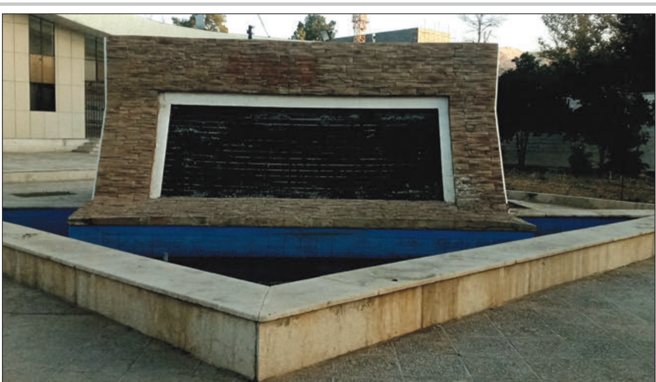
انتظار طولانی شهروندان برای راه اندازی ساعت آبی خلد برین

استاندار فارس در جلسه ستاد تنظیم بازار قیمت های مصوب ستاد تنظیم بازار باید رعایت شود