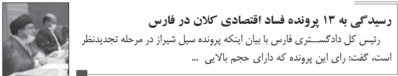
رسیدگی به ۱۳ پرونده فساد اقتصادی کلان در فارس رئیس کل دادگستری فارس با بیان اینکه پرونده سیل شیراز در مرحله تجدیدنظر است، گفت: رای این پرونده که دارای حجم بالایی ...