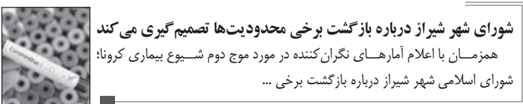
شورای شهر شیراز درباره بازگشت برخی محدودیت‌ها تصمیم‌گیری می‌کند همزمان با اعلام آمارهای نگران‌کننده در مورد موج دوم شیوع بیماری کرونا، شورای اسلامی شهر شیراز درباره بازگشت برخی ...