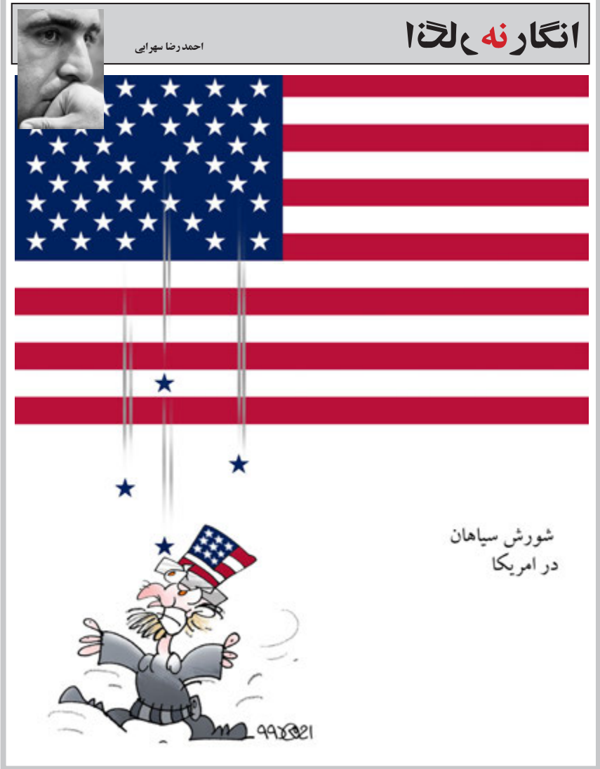
شورش سیاهان در امریکا