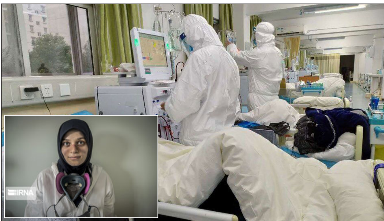
پزشکان و پرستاران مبتلا به کرونا در فارس بهبودی یافتند

قاچاقچیان این بار با ۳۸۷ کیلو تریاک در لارستان زمین گیر شدند