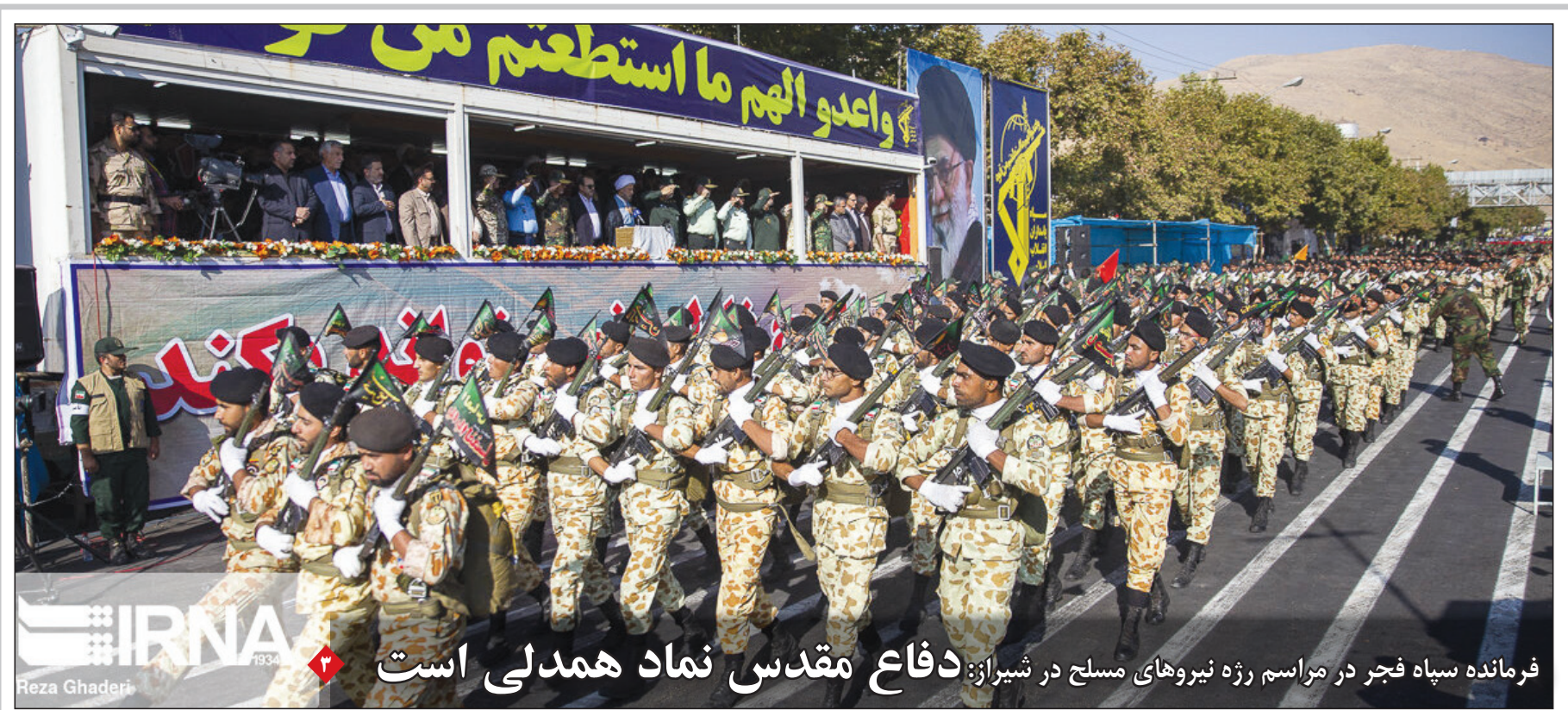
فرمانده سپاه فجر در مراسم رژه نیروهای مسلح در شیراز: دفاع مقدس نماد همدلی است