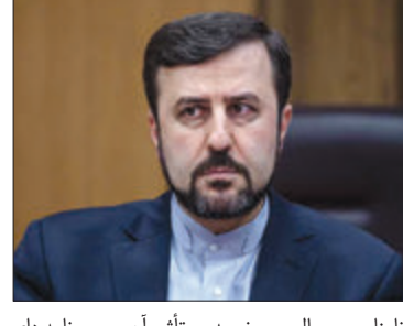
نماینده مالی یونیدو و تأثیر آن بر برنامه‌های توسعه ای این سازمان و عملکرد مؤثر آن، ابراز نگرانی کرد و از مدیرکل خواست تا تلاش‌های خود

برای وصول بدهی آمریکا مربوط به قبل از خروج این کشور از یونیدو که افزون بر ۶۰ میلیون یورو می‌باشد را مضاعف کند. وی افزود: خروج این کشور از سازمان‌های بین‌المللی، هیچ مبنای حقوقی برای پرداخت نکردن حق‌السهم خود به این سازمان‌ها را فراهم نمی‌کند. یونیدو به‌عنوان یک سازمان بین‌المللی مستقل و با هدف تسریع در فرایند صنعتی کردن کشورهای در حال توسعه، در سال ۱۹۶۶ ایجاد شد و هم‌اکنون ۱۶۸ کشور عضو آن هستند. یونیدو در حال حاضر هفت طرح در جمهوری اسلامی ایران در دست اجرا دارد.