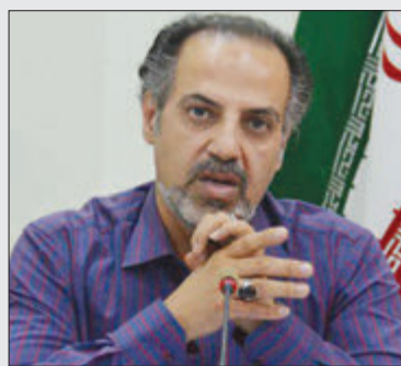
اروپا همچنان مسیر دیپلماتیک را ادامه می‌دهد