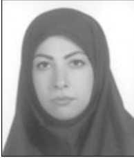
هنری سینمایی‌شان داشته باشند.

در این جهت بعضاً فیلمسازان و کارگردانان دارای آثار شاخص و قابل اعتنا در انواع ژانرها و یا ژانر به خصوصی که در آن تبحر داشته‌اند؛ با این رویکرد، و به تجربه ساختن فیلم جنایی و پلیسی، فیلم‌های قابل اعتنا و شاخصی را خلق کرده‌اند. استقبال مخاطبان از فیلم‌های جنایی و پلیسی باعث گردیده که بارها دست به این تجربه بزنند. البته این رویکرد در فیلم، در میان اغلب بازیگران شاخص و ستاره‌هایی که در دوران بازیگری‌شان نقش‌های پلیسی هم ایفا کرده‌اند؛ بسیار دیده می‌شود و رویکردی رایج است.