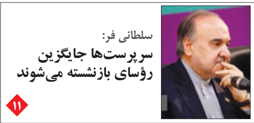
سلطانی فر: سرپرست‌ها جایگزین رؤسای بازنشسته می‌شوند