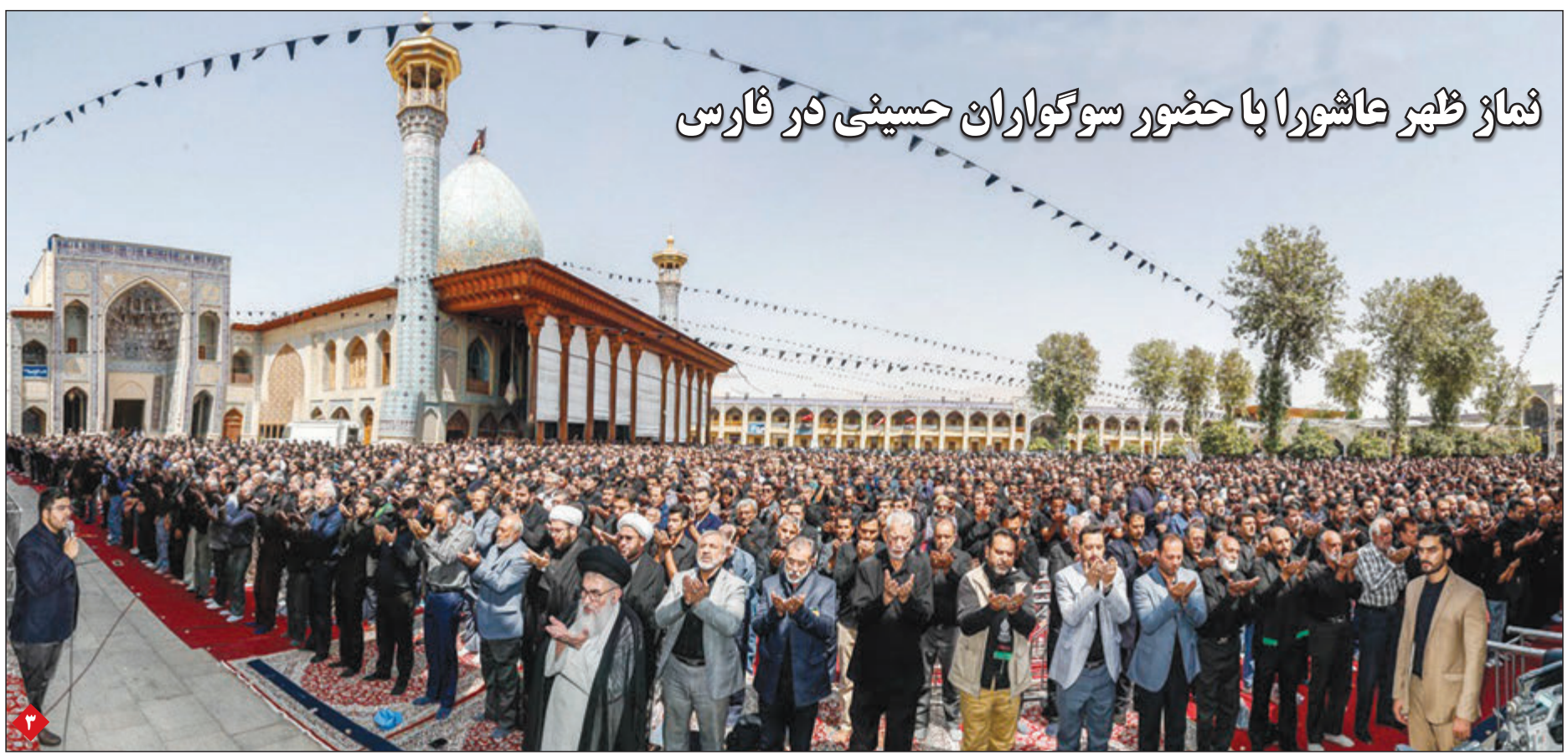
نماز ظهر عاشورا با حضور سوگواران حسینی در فارسی