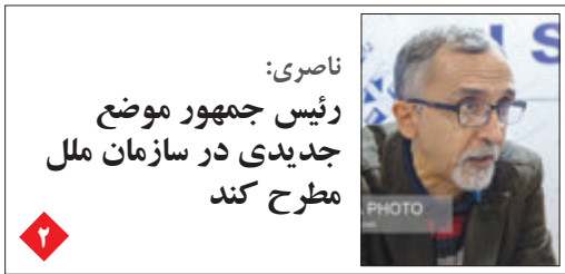
ناصری: رئیس‌جمهور موضع جدیدی در سازمان ملل مطرح کند