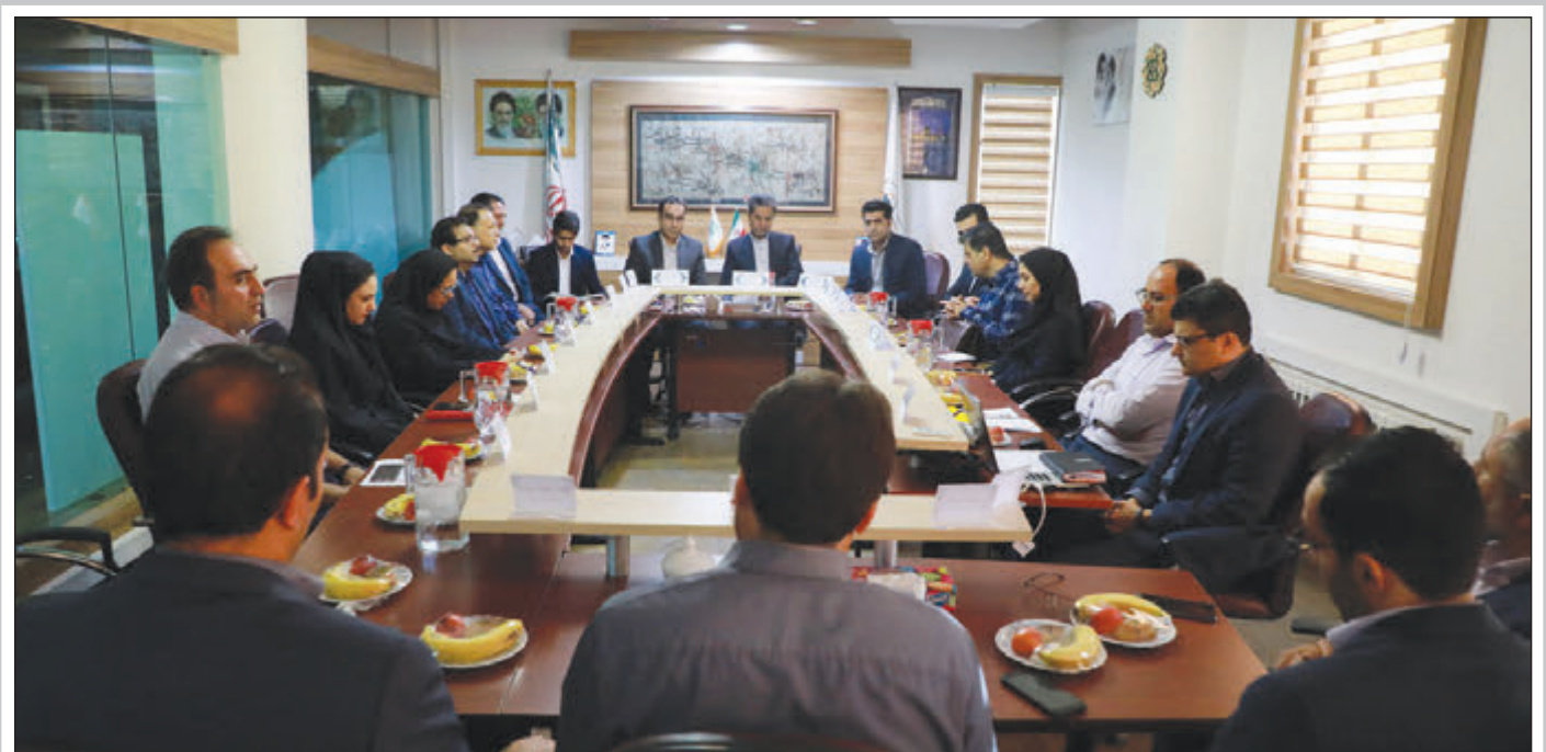
شهردار شیراز در جریان بازدید از سازمان مدیریت پسماند: از افکار و ایده‌های نو استقبال می کنیم