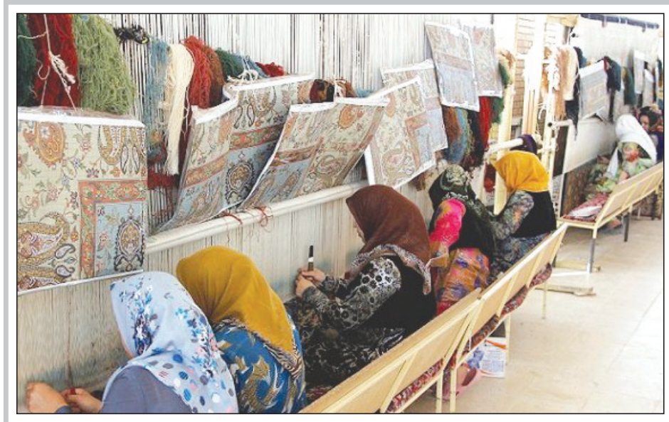
تولید هر تخته فرش ۱۰ نفر را مشغول کار می کند