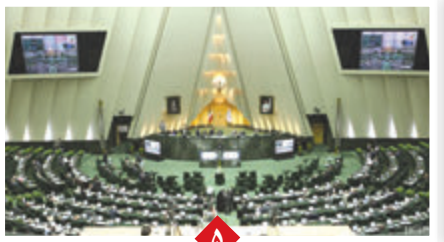
عدم اعلام اموال از سوی مقامات و مسئولان جرم محسوب خواهد شد