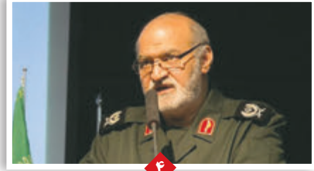
فرمانده سپاه اعلام کرد: آمادگی بسیج و سپاه برای مقابله با خسارت های احتمالی سیل