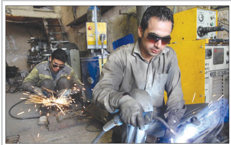
کارگران خواهان دستمزد منصفانه