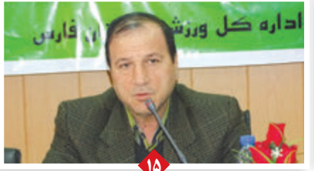
رئیس فدراسیون همگانی کشور؛ ورزش فارس باید در تمام موارد پایلوت باشد