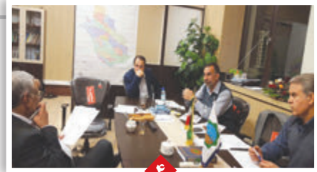
عملکرد ستاد مدیریت بحران فارس قابل قبول است