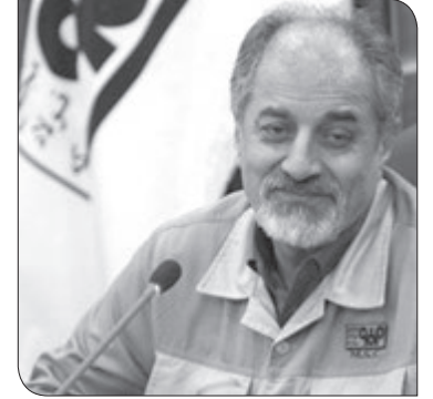
افزود: ایران قصد دارد طی سالهای آینده به صادرات ۲۰ میلیون تن فولاد دست پیدا کند.

خواهد بود و دولت طبق برنامه به دنبال افزایش ظرفیت تولید فولاد به ۵۵ میلیون تن تا سال ۱۴۰۴ است که از این رقم ۳۵ تا ۳۶ میلیون تن فولاد قرار است به مصرف داخلی برسد. وی