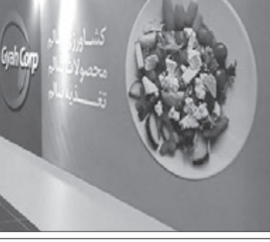
سیر دهمین جشنواره ملی فن آفرینی شیخ بهایی کلید خورد