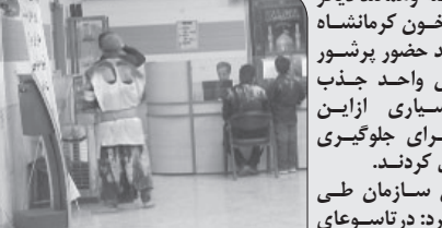
سهیلا تاکستانی نیا: همچون سالهای گذشته وهمانند دیگر مراکز اخون در ایران اداره کل انتقال خون کرمانشاه در روزهای تاسوعاوعاشورای حسینی شاهد حضور پرشور شیفتگان سیدالشهدا(ع) بود. به گزارش واحد جذب برابراهنگی هاوبرنامه ریزی های قبلی بسیاری از این عباداران حسینی نذراه اخون خود را برای جلوگیری از ابتلا نشتی خون به روزهای آینده موکول کردند. زارعی از کارشناسان روابط عمومی این سازمان طی گفت و گو کوتاهی که با ما داشت اعلام کرد: در تاسوعای حسینی سال ۹۴، ۲۹۸ نفر از مراجعه کنندگان موفق به اهدا خون شده اند. وی در ادامه گفت: در مجموع در تاسوعا و عاشورای امسال ۸۰۰ نفر مراجعه داشته ایم که ۸۱ نفر موفق به اهدا خون شده اند و در این زمینه نسبت به سال گذشته رشد ۲۲ درصدی داشته ایم. زارعی در پایان افزود: مجموعاً امسال ۷۰ نفر خانم خون اهدا کرده اند و این رقم نسبت به سال گذشته ۱۰ درصد افزایش را نشان می دهد.

مشتمل بر کمیسیون های مختلف است. وی افزود: تاکنون این نامه هایی که در این کمیسیون مورد بررسی و کارشناسی قرار گرفته است، از جمله این نامه هیات نظارت بر نمایندگان در هیات های مالیاتی، این نامه اعزام هیات های تجاری به خارج از کشور مورد تأیید هیات ریسه و هیات نمایندگان قرار گرفته که در نهایت منجر به تکمیل استراتژی و جارت سازمانی اتاق بازرگانی اصفهان خواهد شد. وی همچنین بر تهیه بانک اطلاعاتی جامع اتاق بازرگانی تأکید کرد و افزود: لازم است دبیرخانه اتاق بازرگانی اصفهان مجری تهیه این بانک اطلاعاتی را معرفی کند و بعد از تأیید در کمیسیون سیاستگذاری، این مجری زیر نظر هیات