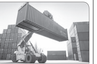
مدیر روابط عمومی شهرداری اصفهان گفت: استفاده حداکثری از ظرفیت رسانه‌ای و تبلیغاتی شهرداری برای سرشماری اینترنتی