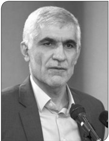
استاندار فارس اظهار داشت: هر کس می خواهد مردم را محکوم کند، قصد دارد خودش را تبرئه کند؛ زیرا همیشه اکثریت مردم، آگاه ترین، عاقل ترین و فهیم ترین هستند.