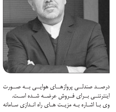
درصد صندلی پروازهای هوایی به صورت اینترنتی برای فروش عرضه شده است.

نوروزی، مرکز نظارت تصویری مهرآباد نیز به بهره برداری رسید تا همه فضای این فرودگاه برای تامین رفاه حال مسافران رصد شود. وی با بیان اینکه امسال بسیاری از مسافران نوروزی توانستند بلیت های هوایی را به طور مستقیم از شرکت های هوایی خریداری کنند، افزود: با برنامه ریزی های انجام شده، ۵۰ هزار صندلی هواپیما به ظرفیت حمل و نقل هوایی کشور اضافه شد. به گزارش ایرنا، عباس آخوندی روز چهارشنبه پس از بازدید از فرودگاه مهرآباد در گفت و گو با خبرنگاران افزود: با آغاز سفرهای نوروزی، پروازهای هوایی نیز افزایش می یابد به طوری که در روزهای آینده، شمار پروازهای هوایی در فرودگاه مهرآباد ۸۰ درصد افزایش پیدا می کند. وزیر راه و شهرسازی با بیان اینکه همزمان با آغاز سفرهای نوروزی یک هزار و ۸۵۰ صندلی قطار نیز به ظرفیت شبکه حمل و نقل ریلی کشور اضافه شد، گفت: برای این روزها ۱۱۱ فروند شناور دریایی با ۷۵۰۰ صندلی آماده شده است. وی، سامانه های ورودی مسافران به فرودگاه مهرآباد، تفکیک رفت و آمد خودروها و بازسازی و بهسازی داخل پایانه های مهرآباد را از اقدامات شرکت فرودگاه ها برای آماده سازی فرودگاه مهرآباد اعلام کرد.