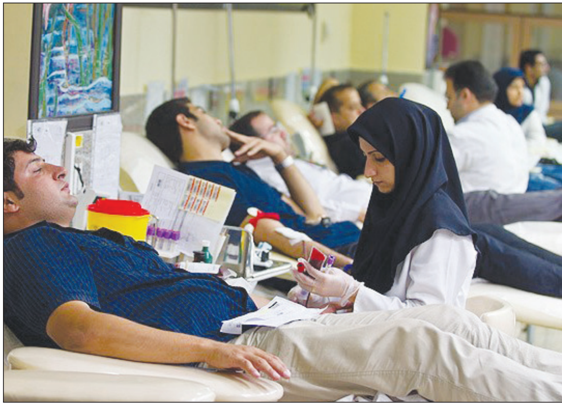
هشدار مدیرکل انتقال خون؛ ذخایر خونی فارس کاهش یافت

جزئیات تفاهم نامه ها و مذاکرات با کشورهای خارجی