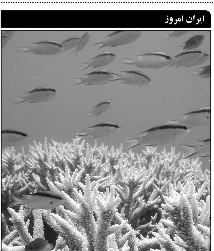
رئیس اداره محیط زیست کیش گفت: در صورت مشاهده و اثبات هر گونه تخلف در آسیب رساندن به مرجان ها از فرد خاطی برای هر کیلو مران طبق قوانین کشوری مبلغ ۲۰ میلیون ریال خسارت دریافت می شود.

از سوی گردشگران انتخاب می شود؛ زیرا از یک سو دارای امکانات و تسهیلات متعددی است، و از دیگر سو با دارا بودن جاذبه های متنوع تاریخی و فرهنگی، مکانی مناسب در راستای توسعه ی گردشگری شهری و فرهنگی محسوب می شود. امروزه صنعت گردشگری یکی از پررونق ترین فعالیت ها به شمار می رود و هرگونه برنامه ریزی در جهت گسترش کمی و کیفی این صنعت، گام مهمی در توسعه اقتصاد و فرهنگی جوامع محسوب می شود. با برنامه ریزی جامع برای توسعه گردشگری، با هدف افزایش کمی تعداد گردشگران و سپس افزایش کیفی خدمات، می توان به توسعه اقتصادی و فرهنگی اصفهان پیش از پیش امیدوار بود.