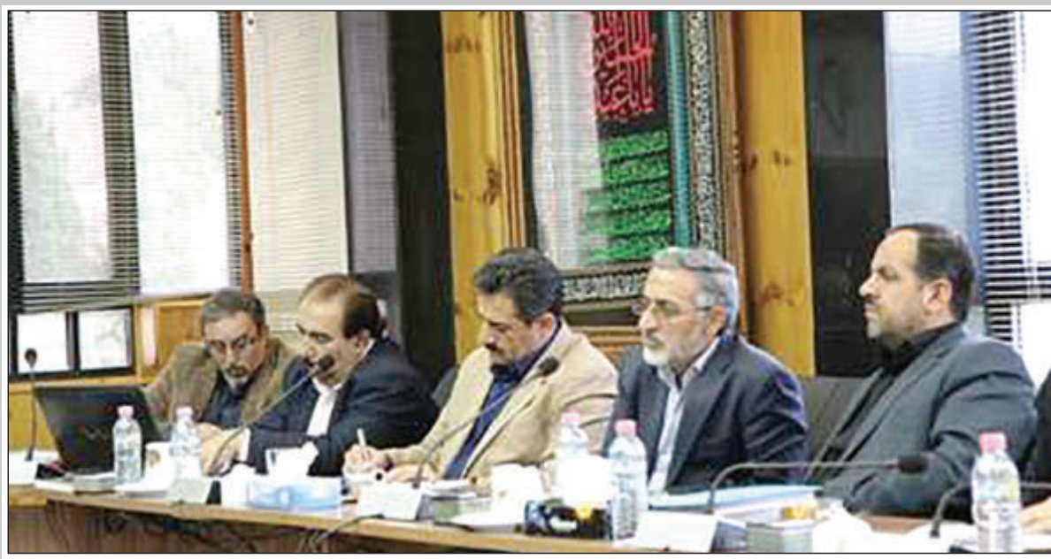
در نشست شورای مشورتی توسعه استان اعلام شد؛ شیراز در بن بست قرار نگیرد ۳

۵ راهبردهای جدید سیستم بانکی در قالب بسته ضد رکود اعلام شد ۱۳ سختگوی شورای نگهبان: شورای نگهبان جزئیات برجام را بررسی نکرده است ۵ سختگوی زمایش محرم: پیام زمایش محرم آمادگی ارتش در مقابل تهدیدات است ۵ صالحی: اوایل زمستان شاهد به نتیجه رسیدن برجام خواهیم بود ۲