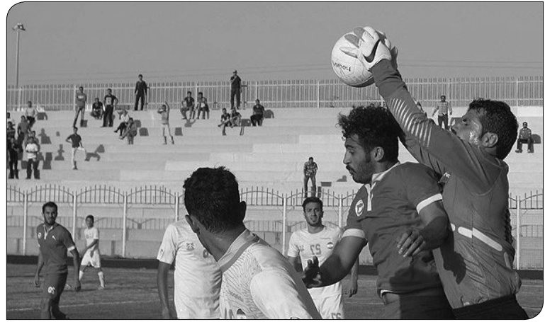
به رده سوم را دارد. رفسنجان‌ها هم که هفته پیش نخستین برد فصل را به پاس همدان تقدیم کردند، برای فاصله گرفتن از قهرنشینان، برای امتیازی را در خانه از دست بدهند. فجرسپاسی

رقابت های لیگ دسته اول فوتبال باشگاه های کشور امروز با دربی کرمانی‌ها و روز سخت تیم‌های فجرسپاسی، پیکان، خونه به خونه و صنعت نفت در خارج از خانه وارد هفته دهم می‌شود. به گزارش خبرنگار مهر، هفته نهم از رقابت‌های فوتبال لیگ دسته اول باشگاه‌های کشور عصر امروز با برگزاری ۱۰ مسابقه پیگیری می‌شود که دربی استان کرمان، یکی از دیدارهای حساس و جذاب این هفته است. مس کرمان که به خاطر پیروزی ارزشمند هفته گذشته‌اش برابر ماشین‌سازی به رده چهارم صعود کرد، در خانه همنام رفسنجان به میدان می‌رود، آنهم در شرایطی که تنها شانس رسیدن