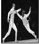
مردان شمشیرباز بر تر فارس شناخته شدند پیکار های شمشیر بازی مردان استان فارس برگزار شد و برترین های این رشته شناخته شدند. گزارش خبرنگار ایرنا، در این مسابقه که ...