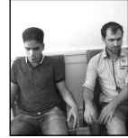
غریبانه وارد شیراز شدیم تیم ملی فوتبال نایبایان ایران با چهار بازیکن فارسی به عنوان قهرمانی آسیا دست یافت اما آنها انتظار داشتند استقبال بهتری از سوی مسوولان ...