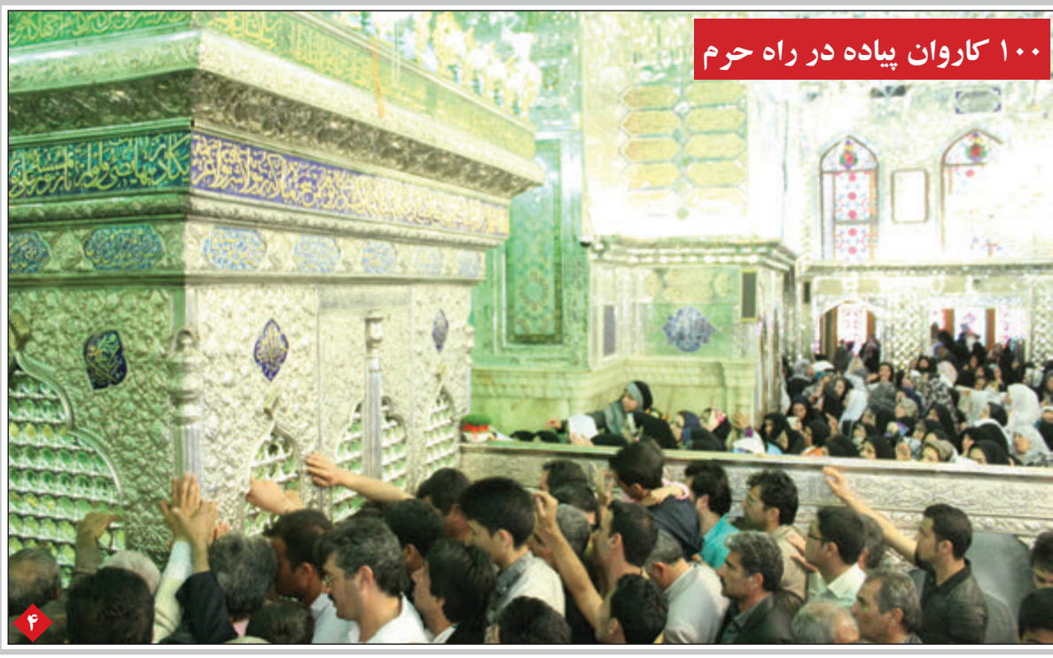
۱۰۰ کاروان پیاده در راه حرم

با تصویب مجلس: دولت مکلف به جذب مریدان پیش دبستانی به صورت حق التدریسی شد ترکیب کمیسیون ویژه برجام با نسبت ۹ به ۶ با اکثریت رهروانی ها تشکیل شد فرماندار جاسک هر مزگان: قاچاقچیان مواد مخدر به دریا روی آورده اند حافظ ناظری: شیراز رمانتیک ترین شهر جهان است