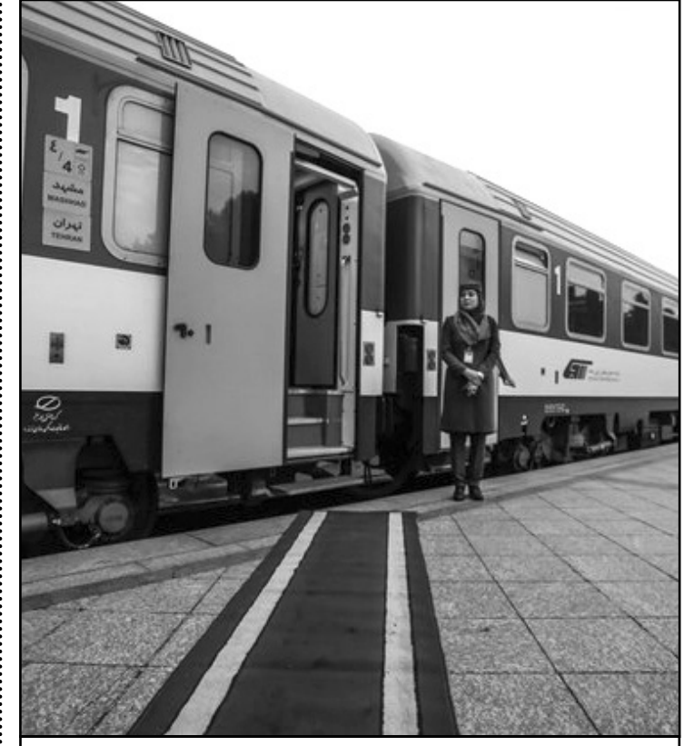
افزایش ۹ درصدی طول راه آهن در اکتو