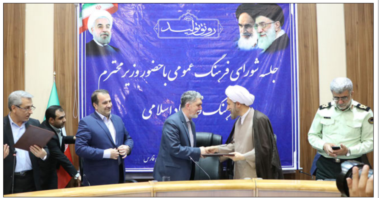
با حضور وزیر ارشاد در شیراز؛ تفاهم نامه توسعه فرهنگ در استان فارس منعقد شد

واکنش شریعتمداری به دستگیری جمعی از کارگران هفت تپه قبل از دیدار با نمایندگان مجلس