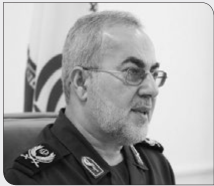
اجازه صدور اضافه خدمت انضباطی برای سربازان را ندارند، گفت: ستادکل نیروهای مسلح بارها تأکید کرده که نباید اضافه‌خدمت انضباطی برای سربازان

رئیس اداره سرمایه انسانی سرباز ستادکل نیروهای مسلح توضیحاتی را درباره بخشش اضافه خدمت ناشی از غیبت و تأثیر غیبت در درجه و حقوق سربازان ارائه کرد.