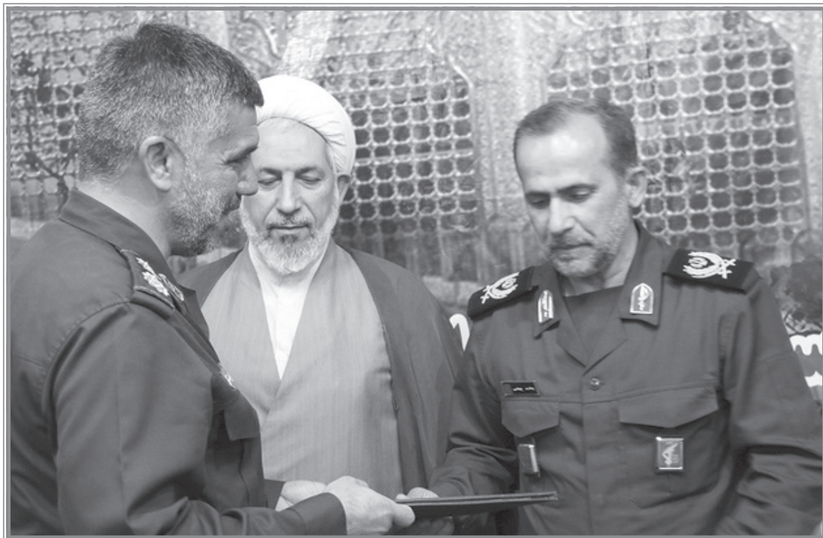
چشم شبیه ای