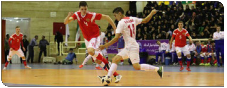
تیم ملی امید فوتسال ایران توانست در دیداری تدارکاتی مقابل روسیه به تساوی دست یابد.

به گزارش ایسنا، تیم ملی فوتسال امید ایران در دومین بازی تدارکاتی‌اش از ساعت ۱۳:۱۵ دیروز در سالن پیامبر اعظم تهران به مصاف تیم ملی امید روسیه رفت و در پایان به تساوی دو بر دو رسید.