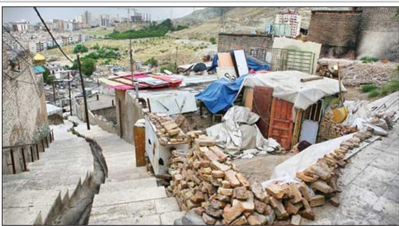
در کارگروه اشتغال استان فارس مطرح شد: حاشیه‌نشینی یک کمربند انتحاری است

شمخانی: اینستکس اروپایی‌ها جویی باریک و کم اثر است مادورو: وزن و نلا آماده از سرگیری مذاکرات با آمریکاست توافق طالبان و آمریکا در باره پیش‌نویس توافق مبارزه با تروریسم و خروج نیروها ساکاشویلی: اوکراین، کریمه را با عضویت در ناتو تاخت می‌زند راهکار جدید ایران برای دور زدن تحریم‌های آمریکا