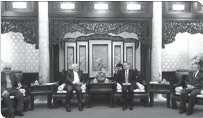
ظریف با اشاره به اینکه به همراه رییس و یک هیات بلند پایه به پکن سفر کرده است، تصریح کرد این سفر شروع تازه ای در روابط دو کشور است و نگاه راهبردی تهران

ایرنا: «محمد جواد ظریف» وزیر امور خارجه جمهوری اسلامی ایران در دیدار با «وانگ یی» همتای چینی خود با اشاره به اهمیت روابط چین و ایران تأکید کرد ایران مهمترین رابطه راهبردی را در جهان با چین دارد.