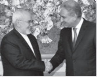
ایرنا: وزیر امور خارجه پاکستان گفت: «هرگز چنین تصویری که توسعه روابط با سعودی را به قیمت کاهش روابط با ایران مقدم

بشماریم نداریم، اهمیت روابط ما با ایران جایگاه ویژه ای را دارد و روابط دو کشور دیرینه و تاریخی است.» شاه محمود قریشی« پس از پایان سفر دو روزه ولیعهد سعودی به اسلام آباد، با حضور در ویژه برنامه سیاسی شبکه «جی‌وی‌وز» پاکستان قریشی در خصوص سفر اخیر بن سلمان به پاکستان و رویکرد سیاست خارجه عمران خان و سفر بن سلمان