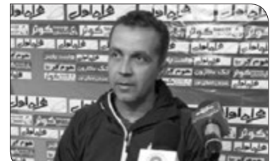
مربی تیم فوتبال قشقایی شیراز گفت: برای تیمی که می خواهد مدعی باشد باید شرایط خوبی فراهم شود اما بازیکنان ما دغدغه مالی دارند و باید به فکر خانواده خود باشند.

خوب بازی را آغاز کرد اما در ادامه بازی را کنترل کردیم و صاحب موقعیت هم شدیم. او گفت: بازی بار فنی بالایی داشت و بازیکنان هر ۲ تیم تا آخرین لحظات تلاش کردند برای همین بازی جذابی ارائه کردند.