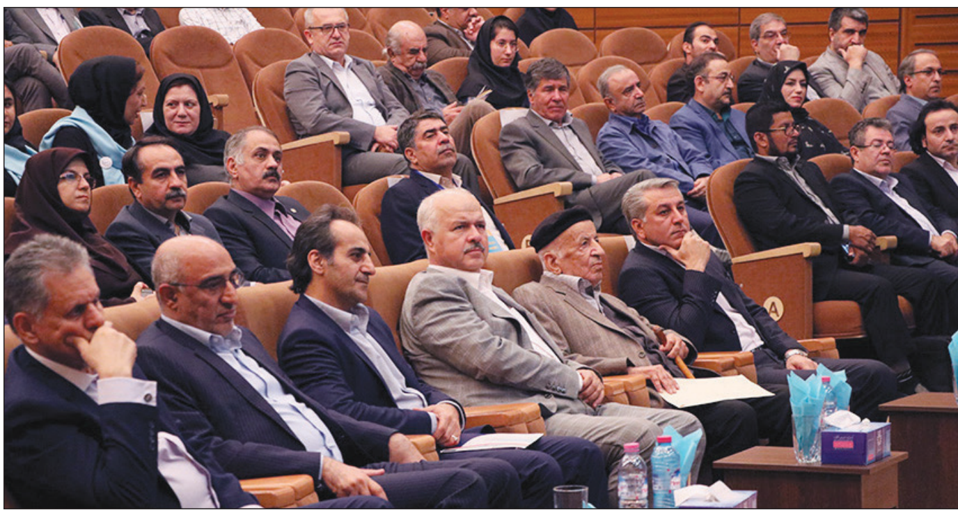
با برپایی گردهمایی بین‌المللی انجمن ترویج زبان و ادب فارسی کلید خورد؛ آغاز آیین‌های بیست و دومین یاد روز حافظ