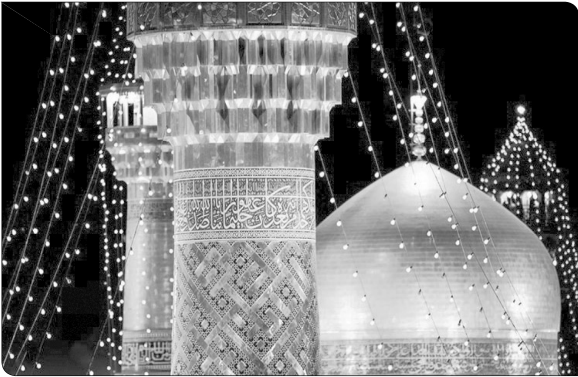
میزبان دوستداران تئاتر خواهند بود.

در کنار سینما و تئاتر، مشهد موزه‌های زیبایی دارد. بزرگترین موزهی شهر مشهد، موزهی آستان قدس رضوی واقع در حرم مطهر است. مجموعه موزه‌های آستان قدس رضوی با بیش از یک میلیون بازدیدکننده در سال، یکی از بزرگترین و غنی‌ترین موزه‌های ایران است. برای کسب اطلاعات بیشتر به سایت موزه‌های آستان قدس سر بزئید.