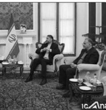
رأس هیاتی عصر روز (دوشنبه ۲۳ بهمن ماه) با امیر عبداللہیان، دستیار ویژه رئیس مجلس شورای اسلامی در امور بین الملل دیدار و گفتگو کرد. دستیار ویژه رئیس مجلس شورای اسلامی در امور بین الملل در ابتدای دیدار با اشاره به روابط دیرینه ایران و فرانسه و تحولات مثبت در روابط دو کشور از جمله توسعه همکاری های سیاسی گفت: فرانسه