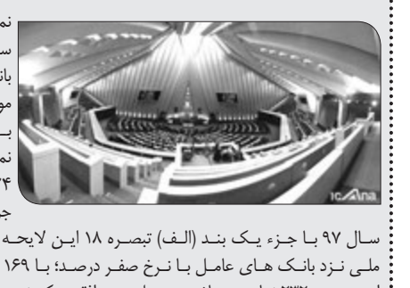
نمایندگان مردم در خانه ملت با سپرده گذاری صندوق توسعه ملی در بانکهای عامل با نرخ صفر درصد موافقت کردند.

به گزارش خبرنگار خبرگزاری خانه ملت، نمایندگان در نشست علنی دیروز (سه شنبه ۲۴ بهمن ماه) مجلس شورای اسلامی در جریان بررسی بخش درآمدی لایحه بودجه سال ۹۷ با جزء یک بند (الف) تبصره ۱۸ این لایحه در خصوص سپرده گذاری صندوق توسعه ملی نزد بانک های عامل با نرخ صفر درصد با ۱۶۹ رأی موافق، ۱۵ رأی مخالف و ۳ رأی ممتنع از مجموع ۳۲۲ نماینده حاضر در جلسه موافقت کردند.