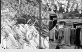
رئیس فراکسیون اصناف مجلس تأکید دارد که نمایندگان مانع هرگونه افزایش قیمت در سال ۹۷ شده اند و برای تنظیم بازار شب عید به قدر کافی در انبارها کالا وجود دارد.

دولت به بهانه تنظیم بازار شب عید اقدام به واردات نکند