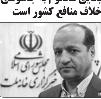
نایب رئیس کمیسیون قضایی و حقوقی مجلس با تأکید بر ارزیابی زندانیان آمریکایی و ایرانی در دو کشور، گفت: اتهام زندانیان آمریکایی در ایران جاسوسی است لذا مذاکره خلاف منافع کشور خواهد بود.