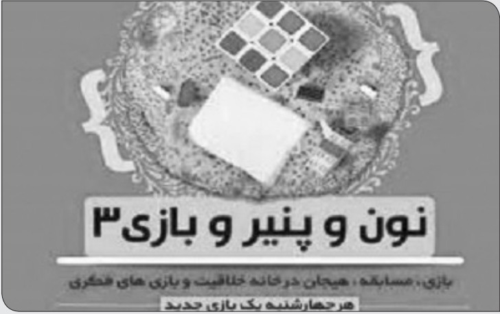
بازی، مسابقه، هیجان در خانه خفایت بازی های هنگری هر چهارشنبه یک بازی جدید

اصفهان - حبیب صادقی - جشنواره نون و پنیر و بازی در خانه خلاقیت و بازی های فکری با برگزاری بازی معماهای کبریتی که یکی از محبوب ترین بازی ها در جهان است، ادامه یافت.