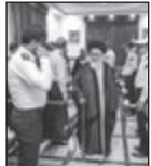
صفر دوام / عصر مردم