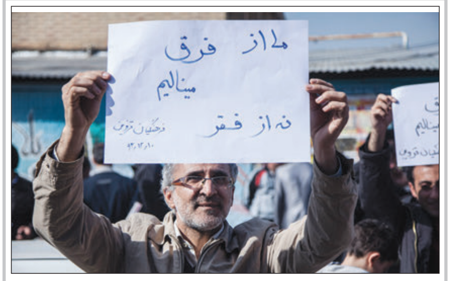
صدایی که باید شنیده شود