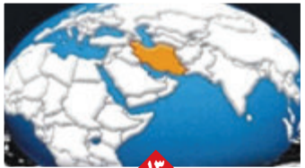
وطنی: عقد قراردادهای نفتی قدرت چانه زنی کشور را افزایش می دهد

مسکو سیاست جدید ترامپ در قبال کوبا را تأسف بار خواند