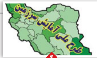
تدوین سند آمایش فارس به کجا رسید؟

تهران و الجزیره روابط مستحکمی دارند وزیران خارجه ایران و الجزایر پس از گفتگو در باره مسایل مورد علاقه در کنفرانسی خبری به تشریح جزئیات این دیدار پرداختند. به گزارش ایسنا، محمد جواد ظریف در نشست خبری با تشریح از میزان گرم و صمیمانه الجزایر گفت: ایران و الجزایر روابط دو جانبه بسیار مستحکمی در حوزه های اقتصادی، سیاسی، منطقه ای و بین المللی دارند و همواره گفتگوها بین دو کشور در جریان بوده است. وی گفت: در دیدار با وزیر خارجه در مورد روابط دو جانبه، سیاسی و اقتصادی و نحوه پیشبرد این همکاری ها در حوزه هایی از جمله خودروسازی، ساخت و ساز و غیره گفتگو کردیم. ظریف ادامه داد: در مورد موضوعات منطقه ای و مقابله با تروریسم و افراط گرایی گفتگوهای خوب و سازنده ای داشتیم. وی تصریح کرد: در مورد ضرورت همکاری بین المللی برای مبارزه با افراط گرایی و احترام به حاکمیت ارضی و عدم مداخله خارجی و ضرورت گفتگو و یافتن راه حل برای حل اختلافات دیدگاه مشترک داریم.