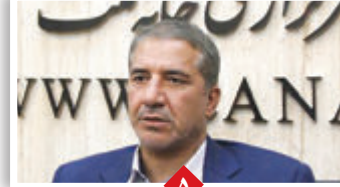
انارکی مطرح کرد: خواب غفلت نهادهای نظارتی در سندسازی های مؤسسات مالی و اعتباری