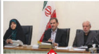
جهانگیری: وزارت کشاورزی طرح جامع الگوی کشت را نهایی کند