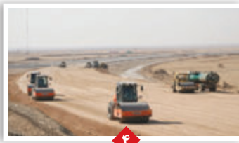
یک بام و دو هوای جاده فراشند - فیروزآباد