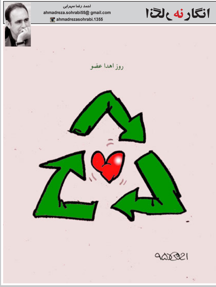
روز اهدا عضو