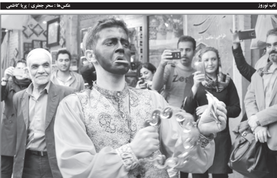
شیراز در تب و تاب نوروز