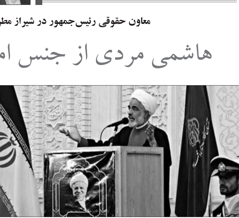
معاون حقوقی رئیس‌جمهور گفت: