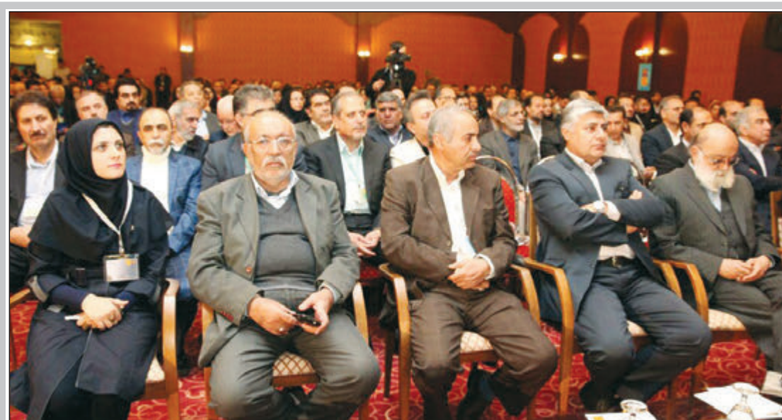
آغاز به کار؛ اولین همایش ملی شهرسازی و معماری ایرانی - اسلامی در شیراز ۱۶

جانشین پلیس راهور نیروی انتظامی کشور: هیچ دستگاه نظارتی نمی‌گوید که چرا تعداد تلفات جانی در جاده‌های کشور سالانه ۱۷ هزار کشته است؟ شورای عالی آب برای ۱۸ حوضه مسأله‌دار تصمیم‌گیری می‌کند مسئول نمایندگی ولی فقیه در سپاه عشایر فارس: اگر دشمن از نام شخصی بدش به لرزه افتاد آن شخص به درد مجلسین می‌خورد