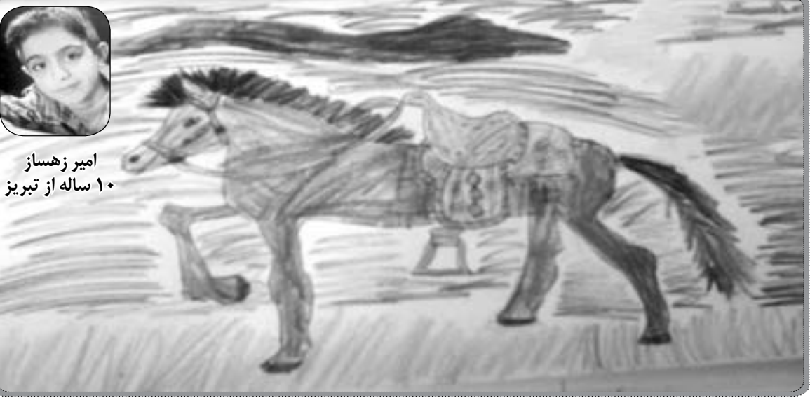
امیر زهساز ۱۰ ساله از تبریز