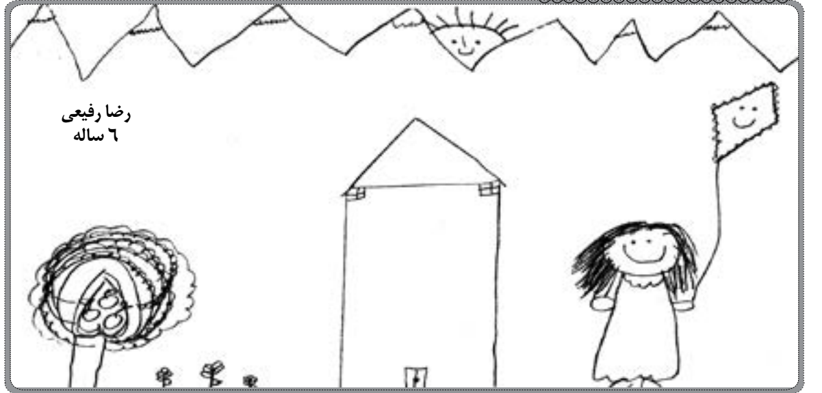
رضا رفیعی ۶ ساله