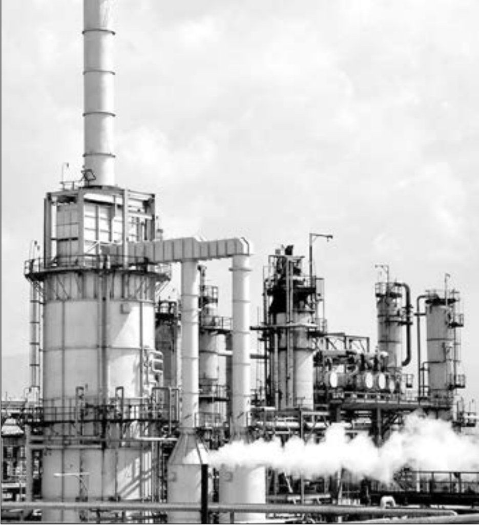
بهای این اختلاطات به وجود آمده را باید بدهد و با دنیای کودکی ناخواسته خداحافظی کند و تن به ازدواج با مردی...